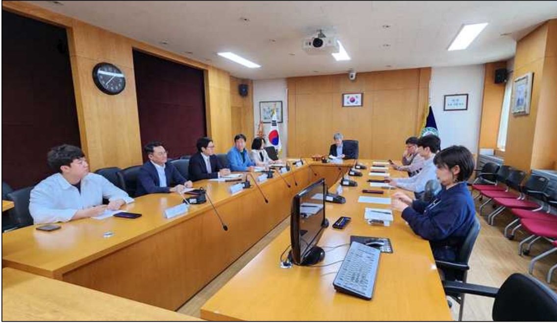
< 2025.05.14. 대학평의원회, 본관 3층 회의실 >